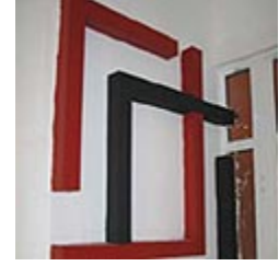
Puzzle & Pattern Atölyesi 3. Grup Çalışmaları Puzzle & Pattern Atölyesi 4. Grup Çalışmaları Puzzle & Pattern Atölyesi 5. Grup Çalışmaları