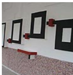
Puzzle & Pattern Atölyesi 1. Grup Çalışmaları