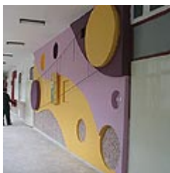
Önceki ve Sonraki Durum